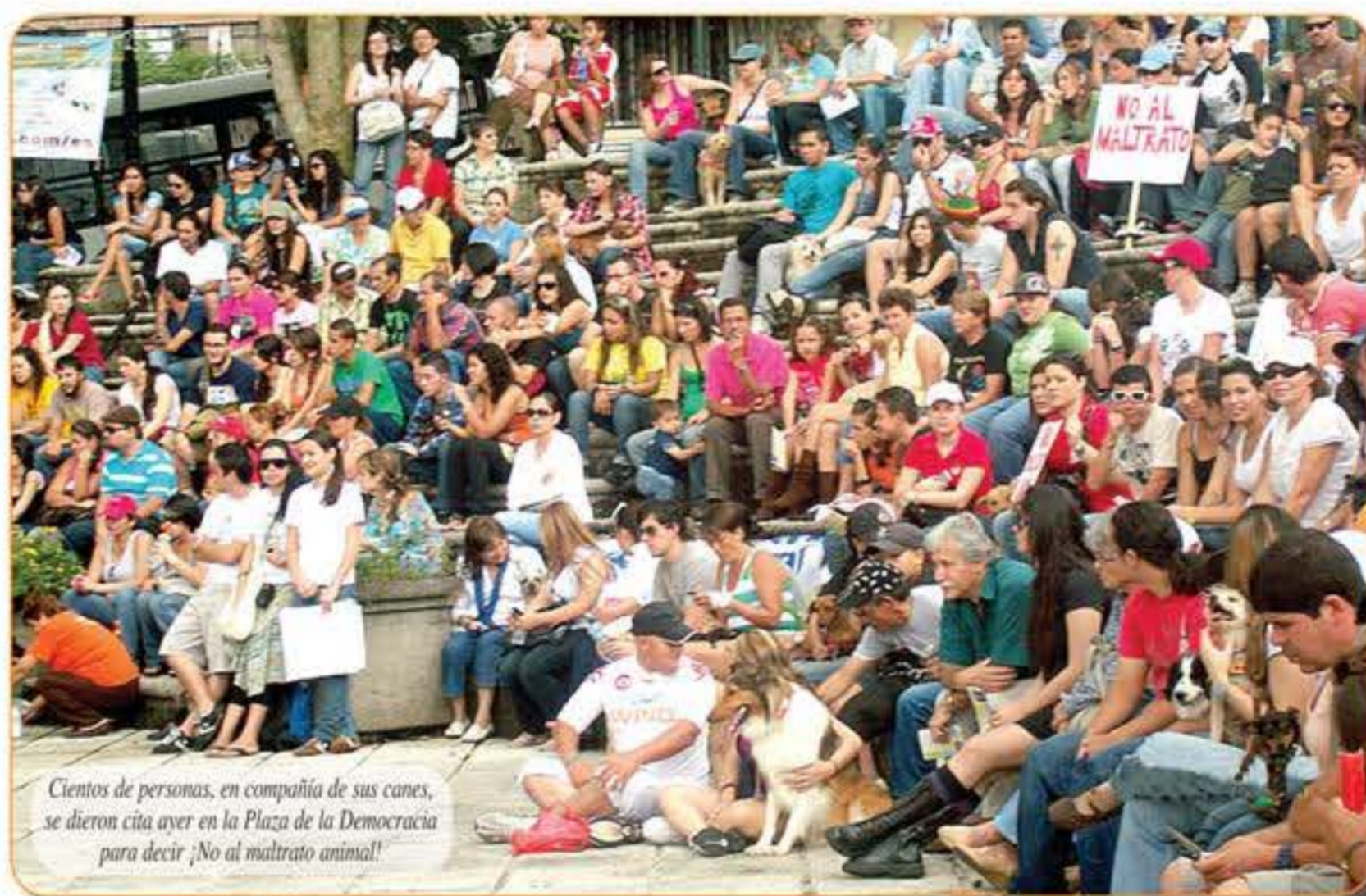
Cientos de personas, en compañía de sus canes, se dieron cita ayer en la Plaza de la Democracia para decir ¡No al maltrato animal!

es una actividad que se debe hacer más seguido, pues aún existen personas que desconocen lo que pasa realmente con muchos animales. Nosotros asistimos a esta marcha con nuestro hijo, para que él