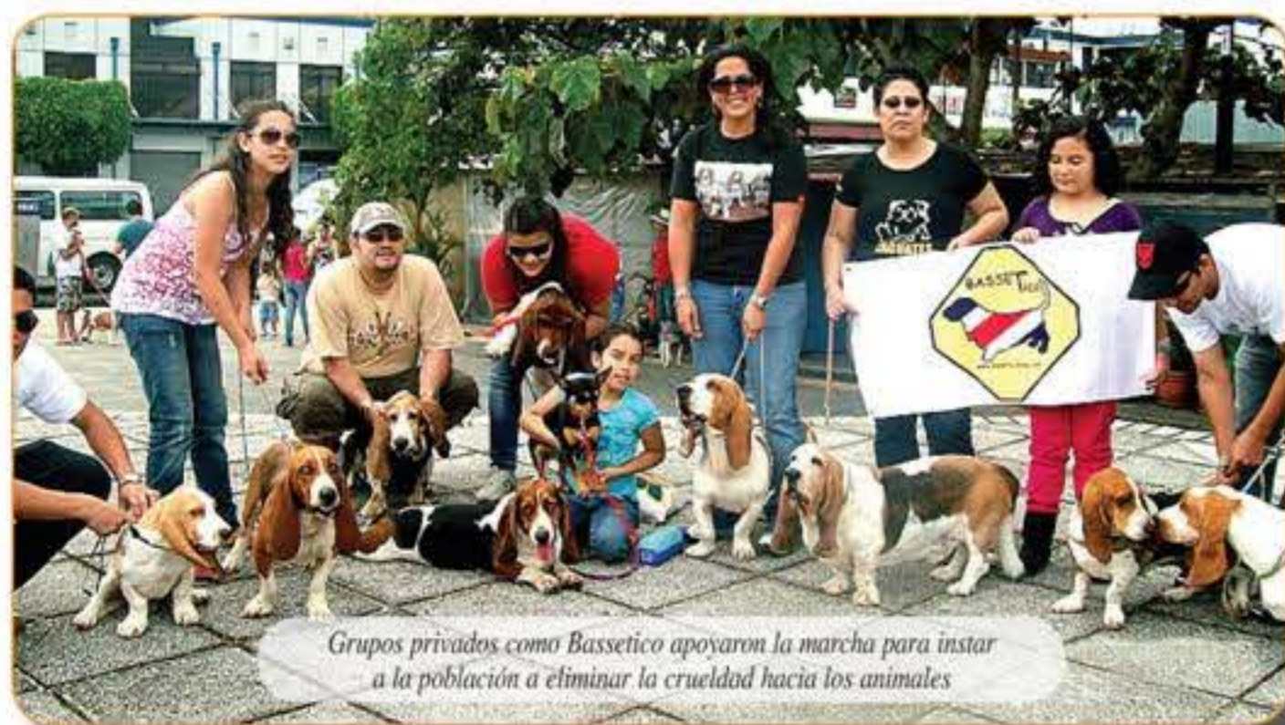
Grupos privados como Bassetico apoyaron la marcha para instar a la población a eliminar la crueldad hacia los animales

cuando las personas abandonan los animales. Ella conoce casos como los de personas que se pasan de vivienda y dejan amarrado a su perro en el patio sin comida ni agua, por ejemplo.